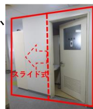
C棟集会室男子トイレの扉の改修イメージ 男子用 出入口(引き戸) 男子用 個室(中折れ)