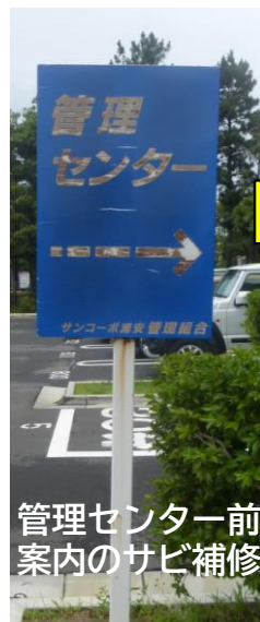
管理センター前案内のサビ補修