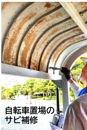
自転車置場のサビ補修